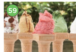
中央区エリアージェラート