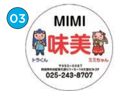
にいがた2kmエリア 韓国料理