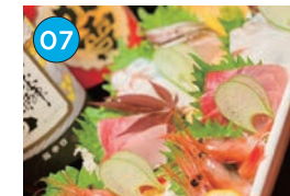
にいがた2kmエリア「居酒屋