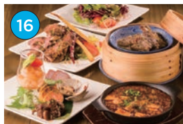
にいがた2kmエリア「中華