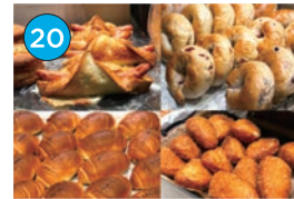
いがた2kmエリア パン