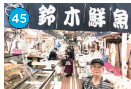
いがた2kmエリア 鮮魚