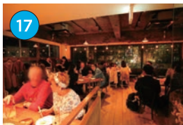
にいがた2kmエリア「居酒屋