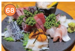
西区エリアー和食