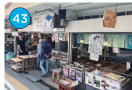
いがた2kmエリア 海産物・お惣菜