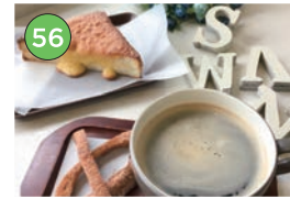
中央区エリアーパン