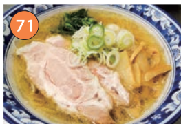
西区エリアーラーメン