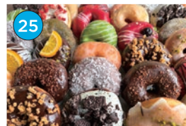
いがた2kmエリア 洋菓子・パン