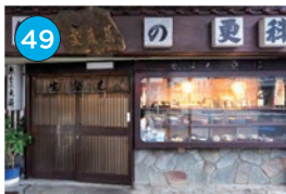
いがた2kmエリア 蕎麦