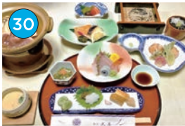
いがた2kmエリア 和食