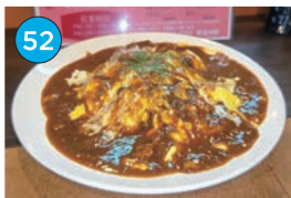
いがた2kmエリア 居酒屋