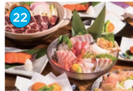
いがた2kmエリア 居酒屋