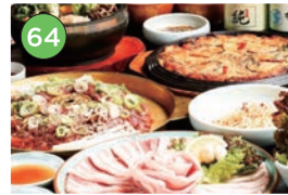
中央区エリアー韓国料理