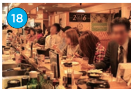
にいがた2kmエリア「居酒屋