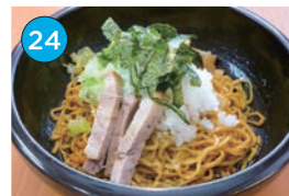
いがた2kmエリア ラーメン