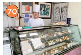
西区エリアー洋菓子