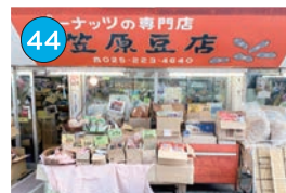
いがた2kmエリア 豆菓子