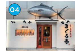
にいがた2kmエリア「居酒屋