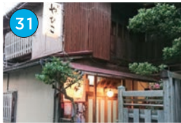
いがた2kmエリア 和食