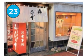
いがた2kmエリア 和食