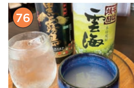
西区エリア一蕎麦