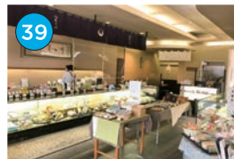
いがた2kmエリア 和菓子