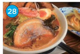
いがた2kmエリア ラーメン