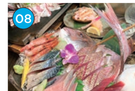
にいがた2kmエリア「居酒屋