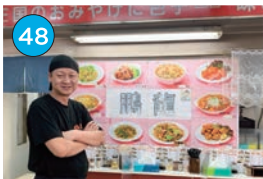
いがた2kmエリア 中華