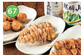
中央区エリアー居酒屋