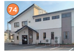
西区エリア一ラーメン