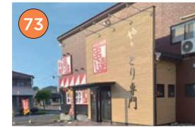
西区エリア一居酒屋