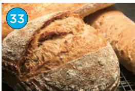
いがた2kmエリア 洋食