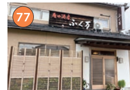
西区エリア一和食