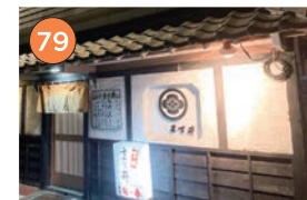
西区エリア一和食