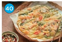
いがた2kmエリア 韓国料理