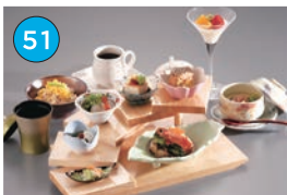
いがた2kmエリア 和食