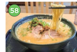
中央区エリアーラーメン