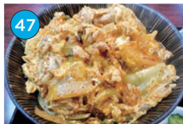
いがた2kmエリア 和食