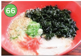
中央区エリアーラーメン