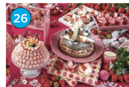
いがた2kmエリア 洋食