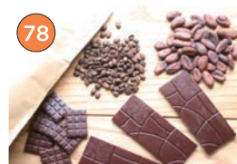
西区エリア一洋菓子