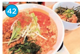
いがた2kmエリア ラーメン