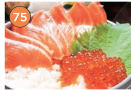
西区エリア一居酒屋