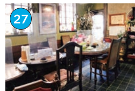
いがた2kmエリア 中華