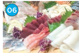
にいがた2kmエリア「居酒屋