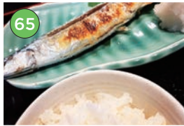
中央区エリアー和食