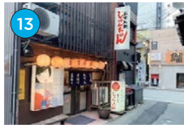
にいがた2kmエリア「居酒屋