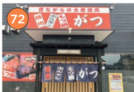
西区エリアー焼肉