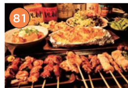
西区エリア一居酒屋