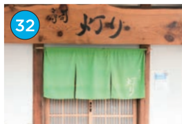
いがた2kmエリア 寿司