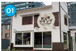
にいがた2kmエリア 居酒屋