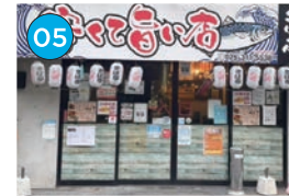
にいがた2kmエリア「居酒屋