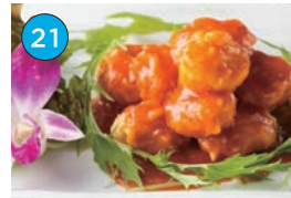
いがた2kmエリア 中華