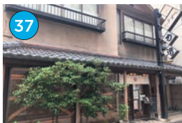
いがた2kmエリア 和食