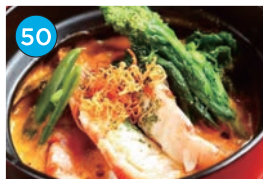
いがた2kmエリア 洋食