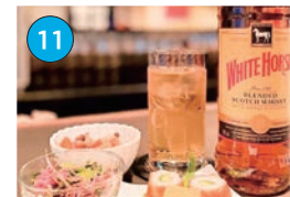
にいがた2kmエリア「アメリカンパブ