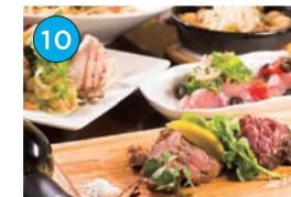
にいがた2kmエリア「洋食