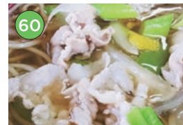
中央区エリアー蕎麦