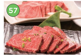
中央区エリアー焼肉