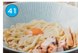
いがた2kmエリア ラーメン