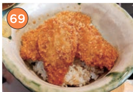
西区エリアー和食