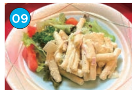
にいがた2kmエリア「居酒屋