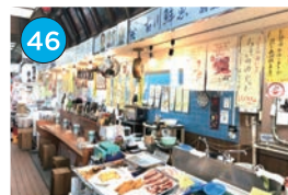
いがた2kmエリア 鮮魚