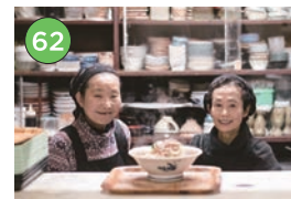
中央区エリアー食堂