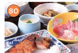
西区エリア一和食