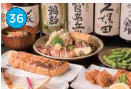
いがた2kmエリア 居酒屋