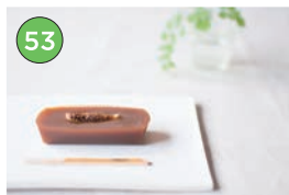
中央区エリア 和菓子