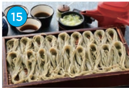
にいがた2kmエリア「蕎麦