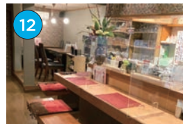
にいがた2kmエリア「居酒屋