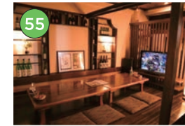
中央区エリアー居酒屋