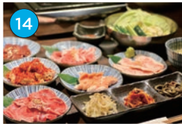
にいがた2kmエリア「焼肉