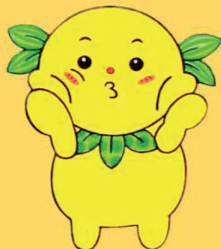
けんしんジーズくん®

新潟縣信用組合 月岡支店 〒959-2338 新発田市月岡温泉60 5番地1 5 0254-32-2500