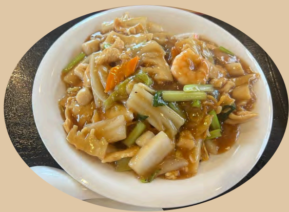
五目あんかけやきそば