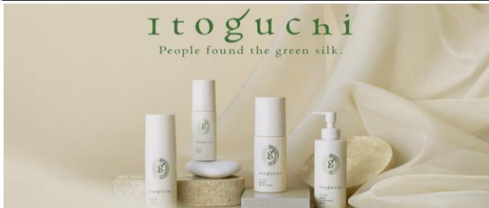
Itoguchi みどりまゆ シルク仕込みスキンケアセット