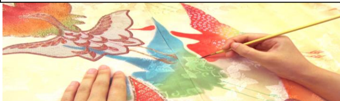
社内の技術者が一つ一つ丁寧に加工しています