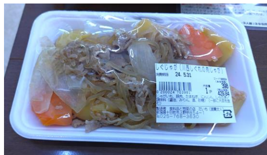
千手小学校の生徒のレシピを商品化した『しぐじゃが』（川西しぐれを使った肉じゃが）

地域になくはないお店』をコンセプトに、昔ながらのお惣菜を一つ一つ手作りにしています。 『だいまも』さんといえば『コロッケ』が有名ですが、他にも千手小学校の生徒と川西商工会「川西しぐれ」のコラボで生まれた『しぐじゃが』、出汁がじゅわっと染み出る『だし巻き卵』などの手作り惣菜オススメです。 お昼前にはたくさんのお惣菜が店頭並びますが、早めに完売することも・・・。電話での予約もできるので、是非、『だいまも』さんのおいしいお惣菜を食べてみてください。