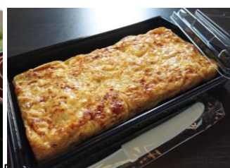
当店人気№1の玉子焼き