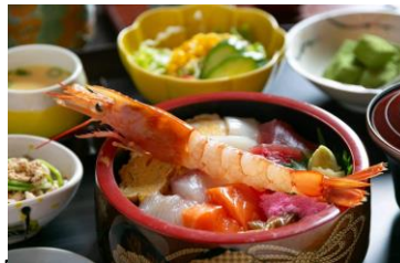
ランチ人気№1の海鮮丼