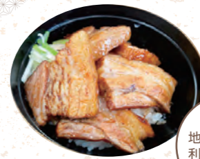
地元の野菜も 利用しています