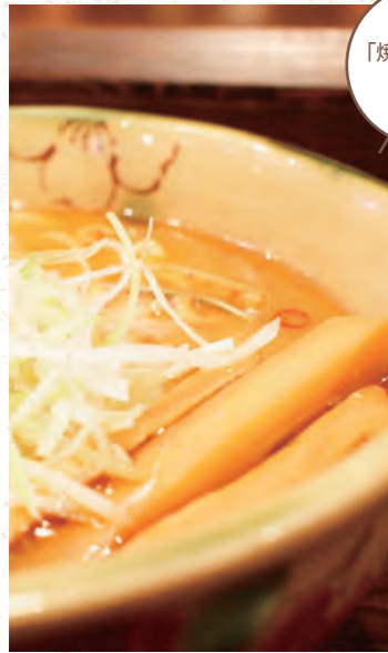
「焼きあご塩」 専門店