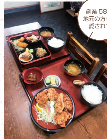
創業58年 地元の方々に 愛されて