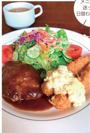
メニューに 迷ったら 日替わりランチ