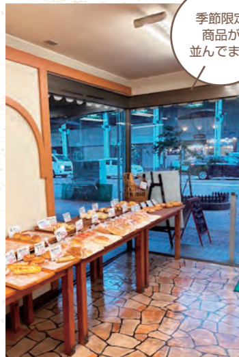
季節限定 商品が 並んでます