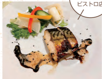
ご夫婦で 営む ビストロ店