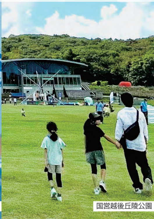
国営越後丘陵公園