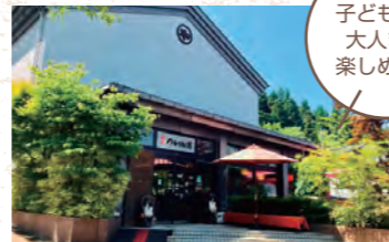
子どもから 大人まで 楽しめます